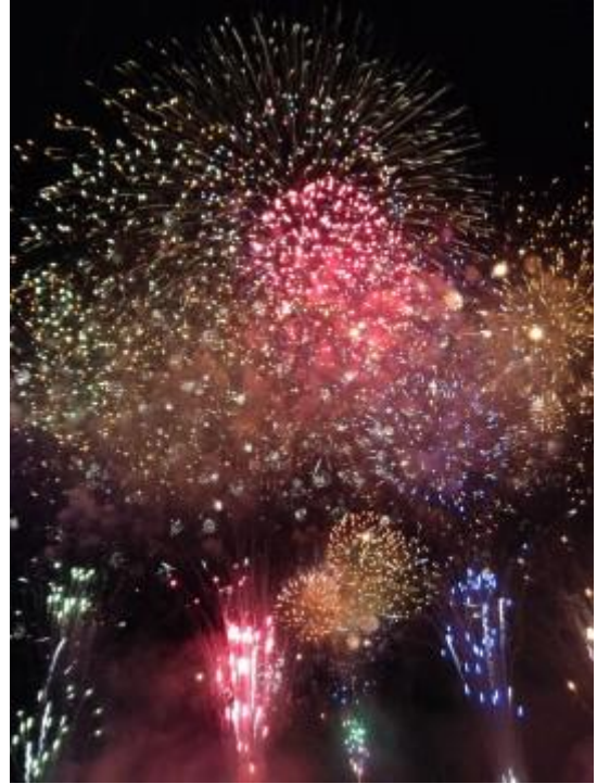
《第55回いたばし花火大会》